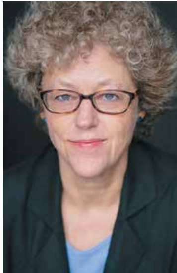
Η Λέζλι Κιν.

Η Κιν μετέφερε το ερευνητικό δημοσιογραφικό της πνεύμα στο Μπέρκλεϊ της Αμερικής, όπου έρευνσε θέματα που αφορούσαν ανθρώπους που είχαν άδικα φυλακιστεί στην Αμερική, τη θανατική ποινή κ.ά. Το 1999 ήρθε σε επαφή με εκθέσεις Γάλλων στρατιωτικών αναφορικά με τις καταγεγραμμένες